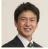
井上 達彦 (いのうえ たつひこ) 早稲田大学商学学術院 教授

1997年神戸大学大学院経営学研究科博士課程修了(経営学博士)。広島大学社会人大学院マネジメント専攻助教授などを経て現職(競争戦略研究、経営組織論を担当)。経済産業研究所ファカルティフェロー、ペンシルベニア大学シニアフェローなどを歴任。2003年経営情報学会論文賞受賞、主な著書に『ゼロからつくるビジネスモデル』(東洋経済新報社)『模倣の経営学 偉大なる会社はマネから生まれる』(日経BP)『ビジュアルビジネスモデルがわかる』(日本経済新聞出版)などがある。