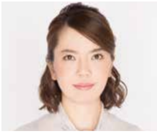
アイ・エス・ガステム株式会社 ビジネス・プランニング&マーケティング室 室長