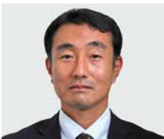
山鈴運輸株式会社 代表取締役社長