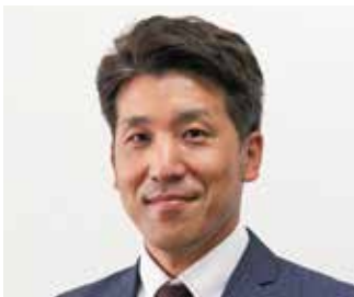
株式会社システムイオ 代表取締役社長