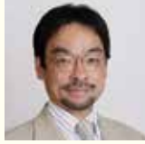
余田 拓郎 (よだ たくろう) 慶應義塾大学大学院 教授

1997年神戸大学大学院経営学研究科博士課程修了(経営学博士)。広島大学社会人大学院マネジメント専攻助教授などを経て現職(競争戦略研究、経営組織論を担当)。経済産業研究所ファカルティフェロー、ペンシルベニア大学シニアフェローなどを歴任。2003年経営情報学会論文賞受賞、主な著書に『ゼロからつくるビジネスモデル』(東洋経済新報社)『模倣の経営学 偉大なる会社はマネから生まれる』(日経BP)『ビジュアルビジネスモデルがわかる』(日本経済新聞出版)などがある。