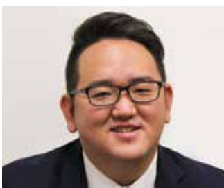
柳澤運送有限会社 取締役