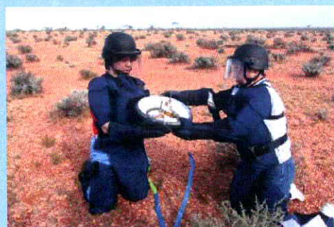
2010 年オーストラリアにてはやぶさカプセルを回収

東京大学大学院工学系研究科 (航空学専攻) 博士課程修了。文部科学省宇宙科学研究所 (現 JAXA) に入所。はやぶさカプセル等の研究開発に携わり、2010 年 6 月の「はやぶさ」カプセルの帰還時には、オーストラリアの砂漠にてカプセル回収を自らの手で行った。2014 年 12 月打ち上げに成功した「はやぶさ 2」をはじめ、さらに遠方天体からのサンプルリターン、惑星突入などの飛翔体、有人帰還機に関する研究開発を進めている。